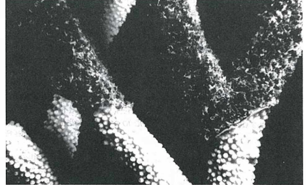
Dalı staghorn Acropora üzerindeki tipik siyah aşırı büyüyen Cyanophyta (BOC) örtüsü. Koloninin beyaz alt kısımları henüz canlıdır(Solda) Acropora sp. üzerindeki siyah aşırı büyüyen Cyanophyta (BOC) enfeksiyonunun yakından görünüşü. Sağdaki dalda hastalık belirgin şekilde mercanın büyümesini engellemektedir(Üstte).