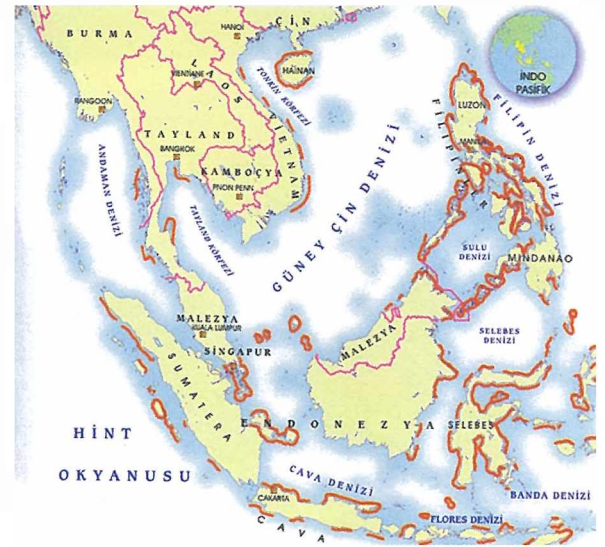
İndopasifik'te tehdit altındaki mercan resiflerini gösteren harita. Atlantik'teki Karayip Denizi'nde yaşayan 67 türe karşı indo-pasifik'te yaşayan mercan türü sayısı 450'nin üzerindedir.

ları altında Doku Beyazlaması (TBL) oluşur ve çok zayıf şartlar altında kapanma reaksiyonu (SDR) başlatılabilir.