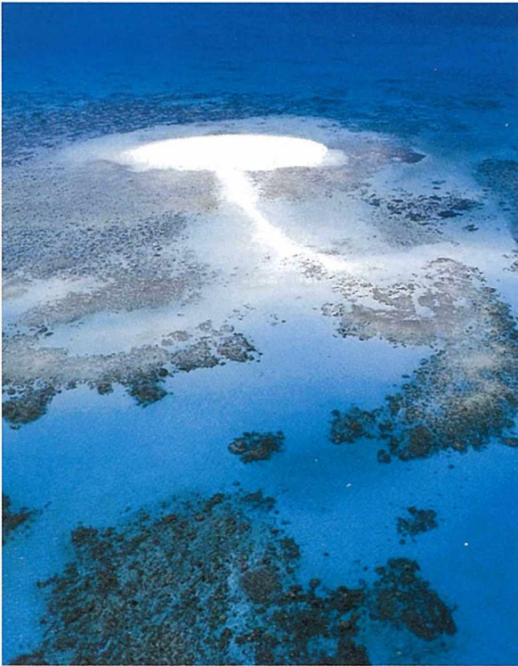
Avustralya'nın doğusunda ikibin kilometreden daha uzun bir alanda yüzeylenen bu cennet köşe, 2900 mercan ve yüzlerce küçük adacıktan oluşur

Burada bahsedilen bütün hastalıklar ve patolojik sendromlar doğal şartlar altında oluşmaktadır. Görünüşte hastalıklar, sağlıklı resifleri tehdit eder durumda değildir. Buna rağmen anthropogenic etkiler bu senaryoyu değiştirmektedir. Kimyasal kirlilik, termal kirlenme, sedimantasyon ve doğrudan gerçekleşen fiziksel etkiler (deniz dibinin taranması, patlatma, bot çapaları, sürücüler vb.) gibi insanların yaratmış olduğu stresler, mercanların bünyelerinde önemli ölçüde yıkıcı basınçlara neden olmaktadır. Buna ek olarak, bu etkiler doğal hastalıkların etkilerini de büyük ölçüde arttırmaktadır. Her türlü kirlenme, mercanlar üzerindeki bakteriyel enfeksiyonları arttırmaktadır. Eutrophication (oksijen ortamının az, besin miktarının çok olduğu derin su altı ortamı) şartları altında Siyah Bant Hastalığı (BBH) gelişir ve normal şartlar hastalığa karşı bağışıklığı olan mercan türlerini yok eder. Ayrıca, bu etki Beyaz Bant Hastalığı (WBD) için de geçerlidir. Eutrophication, beyaz bant hastalığını da başlatabilen siyah aşırı büyüyen Cyanophyte (BOC)'in oluşmasına da neden olmaktadır. Ortamın değişik kombinasyon-