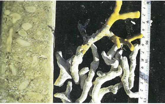
Bahamalar'da Andros Adası'nın yanındaki yama resifinin üst kısımları tamamen küçük ve düzensiz Porites astreoides kolonilerinden oluşmuştur. Resifin beyaz renkli kısımlarında doku beyazlaması hastalığı (TBL) sonucu ölmüş mercanlar bulunmaktadır.

Birleşmiş Milletler çevre Örgütü'nün bugüne değin yaptığı çalışmalara göre dünyadaki mercan kayalıklarının yüzde 10'u tamamen ölmüş, yüzde 58'i ise ağır hasarlı durumdadır. Mercan resiflerindeki patolojik sendromlar, kimyasal kirlilik, dinamik, zehir ve trolle yapılan bilinçsiz balık avcılığı ekolojik dengeyi bozmaktadır.