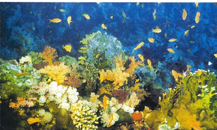
Sağlıklı ve canlı mercan kolonileri. Kızıldeniz'in (Ras Umm Sid-Sinai) yaklaşık 4 m su derinliğinde bulunan Scleractinianlar ve Milleporalar

İndopasifik'te değişik türler üzerinde BBD'nin oluşumu, çok ilginç coğrafik farklılıklar göstermektedir. Kızıldeniz'de bulunan ve en hassas tür olan retiformis, hızlı bozulabilen hassas gruba bağlıdır. Papua Yeni Gine'de, G. retiformis, bu hastalığa karşı daha bağışık olduğunu kanıtlamıştır ve burada karakteristik "immune - (bağışık-ı)" grubuna girmiştir. Bu bölgede BBD octocoral Helipora coerulea üzerinde de bulunmuştur. Millepora, H. coerulea "Rezistant - (dayanıklı) (R)" grubuna konmuştur.